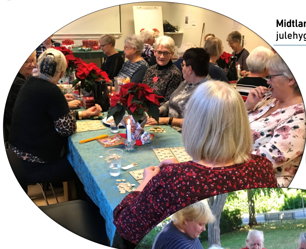
Midtlangelands Husholdningsforening samles til julehygge med banko