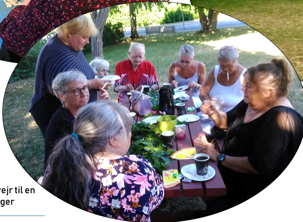
Café Langeland nyder det gode vejr til en af deres ugentlige fællesspisninger