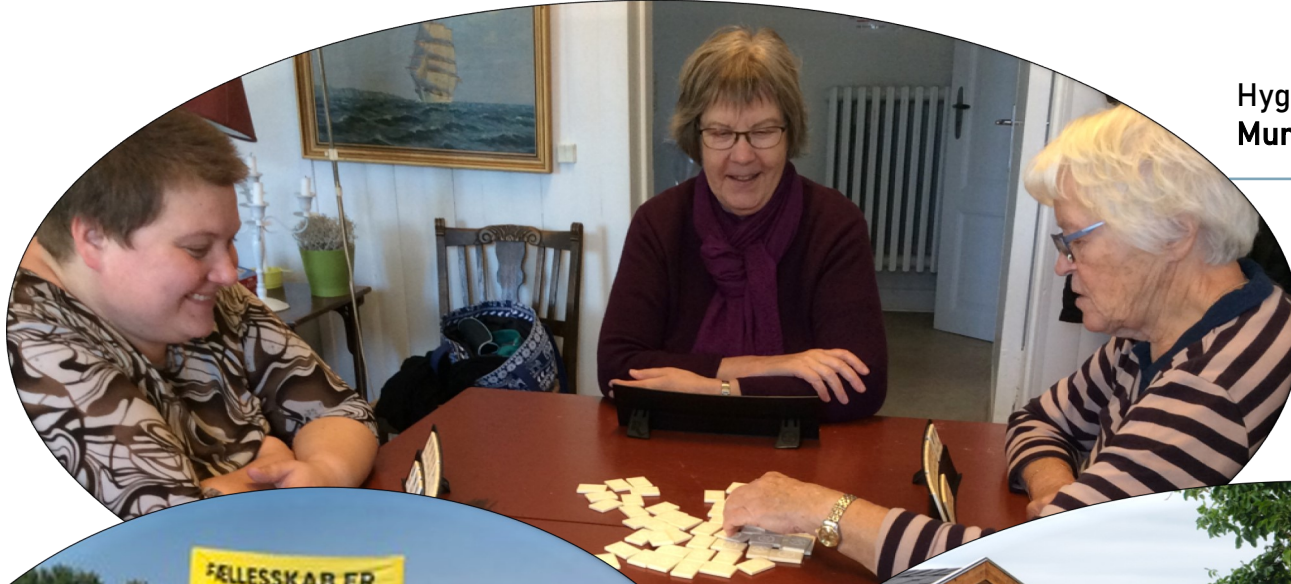
Hyggeligt samvær i Brætspilscaféen "Det Muntre Hjørne"