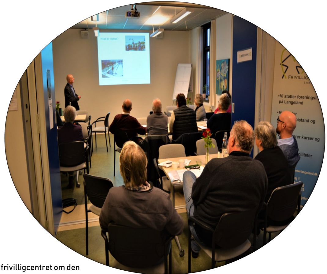
Åbent møde i frivilligcentret om den nye kvalitetsmodel

Frivilligcenter Langeland har i 2018 arbejdet med udviklingen af denne model ved at deltage i høringmøder, samt afgive høringssvar. Derudover er modellen blevet diskuteret heftigt både i centrets bestyrelse samt i det regionale ledernetværk, da vi ønsker en realistisk og brugbar kvalitetsmodel, som afspejler den hverdag vi arbejder i.