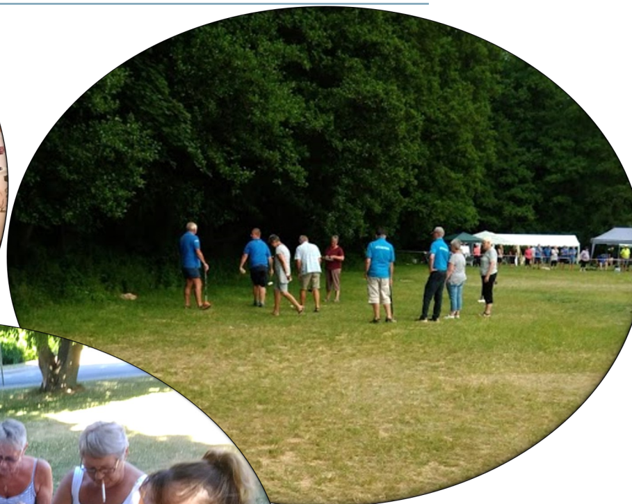
Rudkøbing Krolf-klub til turnering i parkrolf