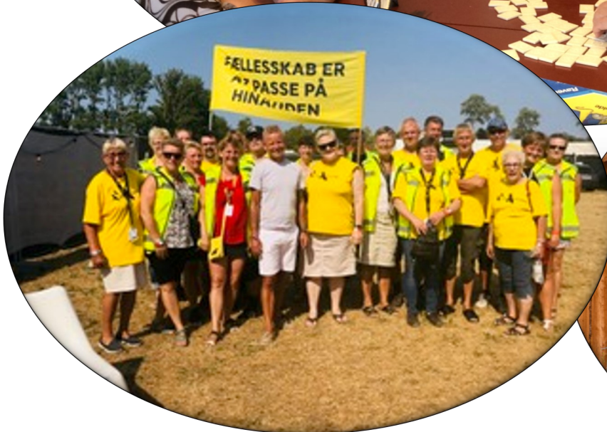
Natteravnene passer på de unge på årets Langelands Festival