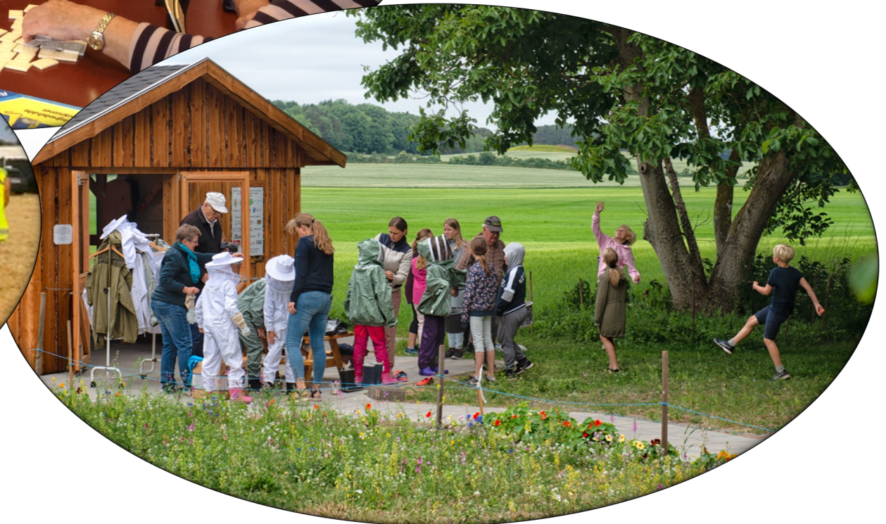
Langelands Biavlerforening underviser elever fra 3. årgang på Ørstedskolen